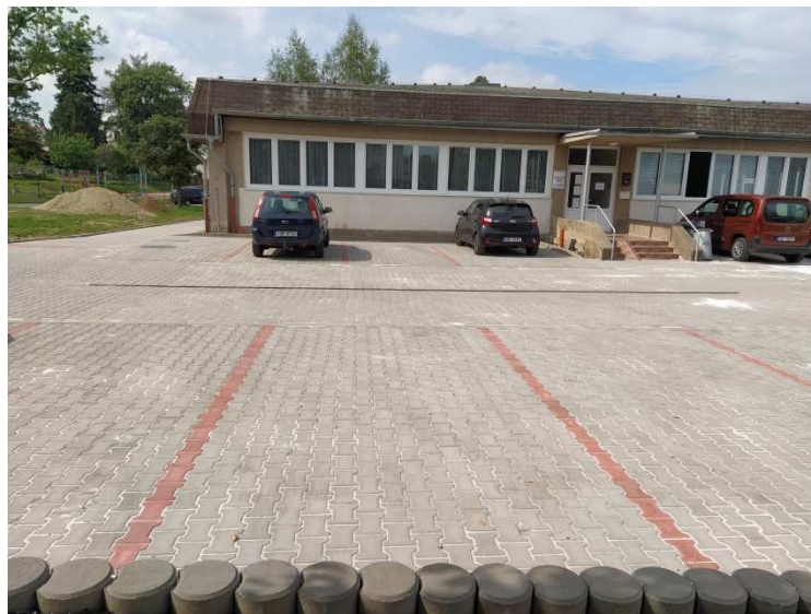
Výstavba parkoviště před zdravotním střediskem: vlevo: 1. července 2022, vpravo 6. září 2022, přibyla 3 parkovací místa pro lékaře a 2 parkovací místa pro pečovatelskou službu.