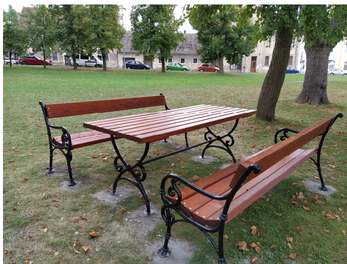
← Kolotoč: nový prvek na hřišti u zdravotního střediska Kmochovo nám. : nové místo k odpočinku a pro přátelská setkávání.

Pozdrav z Doubravčan: Nový kolotoč na dětském hřišti na návsi, informační tabule u zvoničky, která se nachází taktéž na návsi.