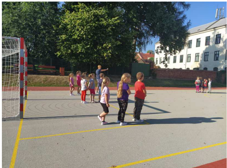
Hodina tělocviku na novém školním hřišti.