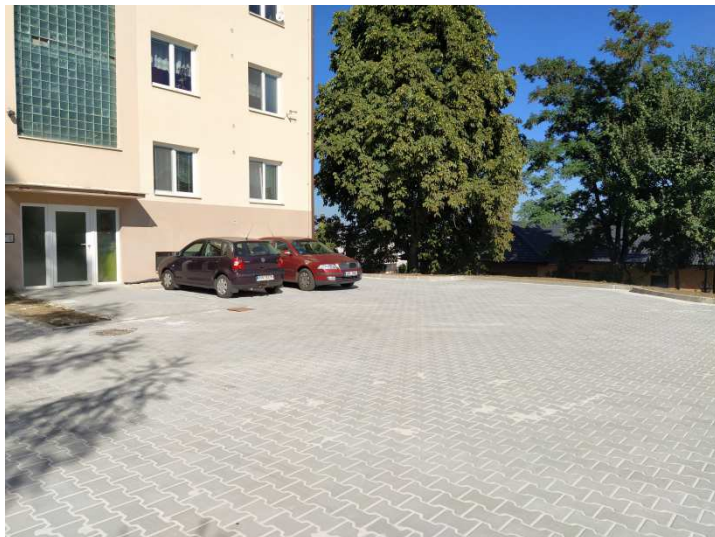
Probíhají dokončovací práce na úpravě pozemku u bytovky č.p.8.