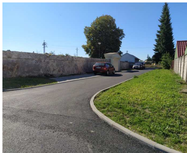
Nová ulice Hřbitovní, zbývá dokončit úpravu hřbitovní zdi a vstupní brány.