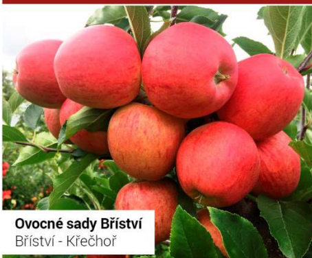
Ovocné sady Bříství Bříství - Křečhoř