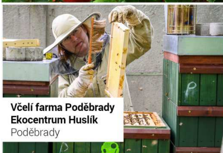
Včelí farma Poděbrady Ekocentrum Huslík Poděbrady