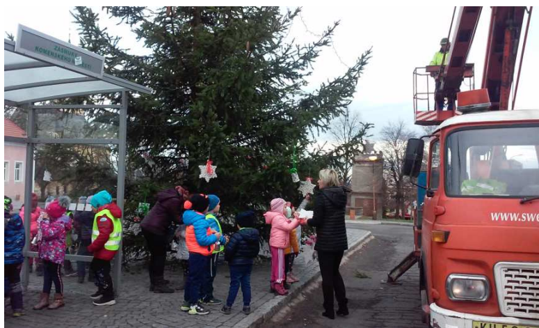
Rozsvícení vánočního stromu 1. 12. 2019