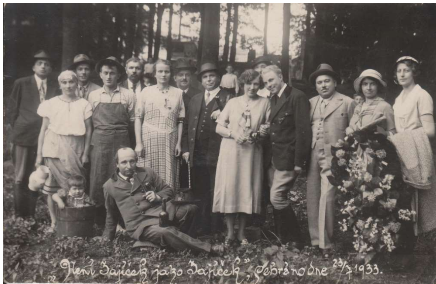
Na snímku vidíte foto (archiv městské knihovny) z představení Spolku divadelních ochotníků v Zásmukách, který zde působil od roku 1864. Díky nalezení dalšího historického pramene Vám přinášíme následující doplňující informace. Šlo o představení sehrané v přírodě Není zajíček jako Zajíček dne 23. 7. 1933.